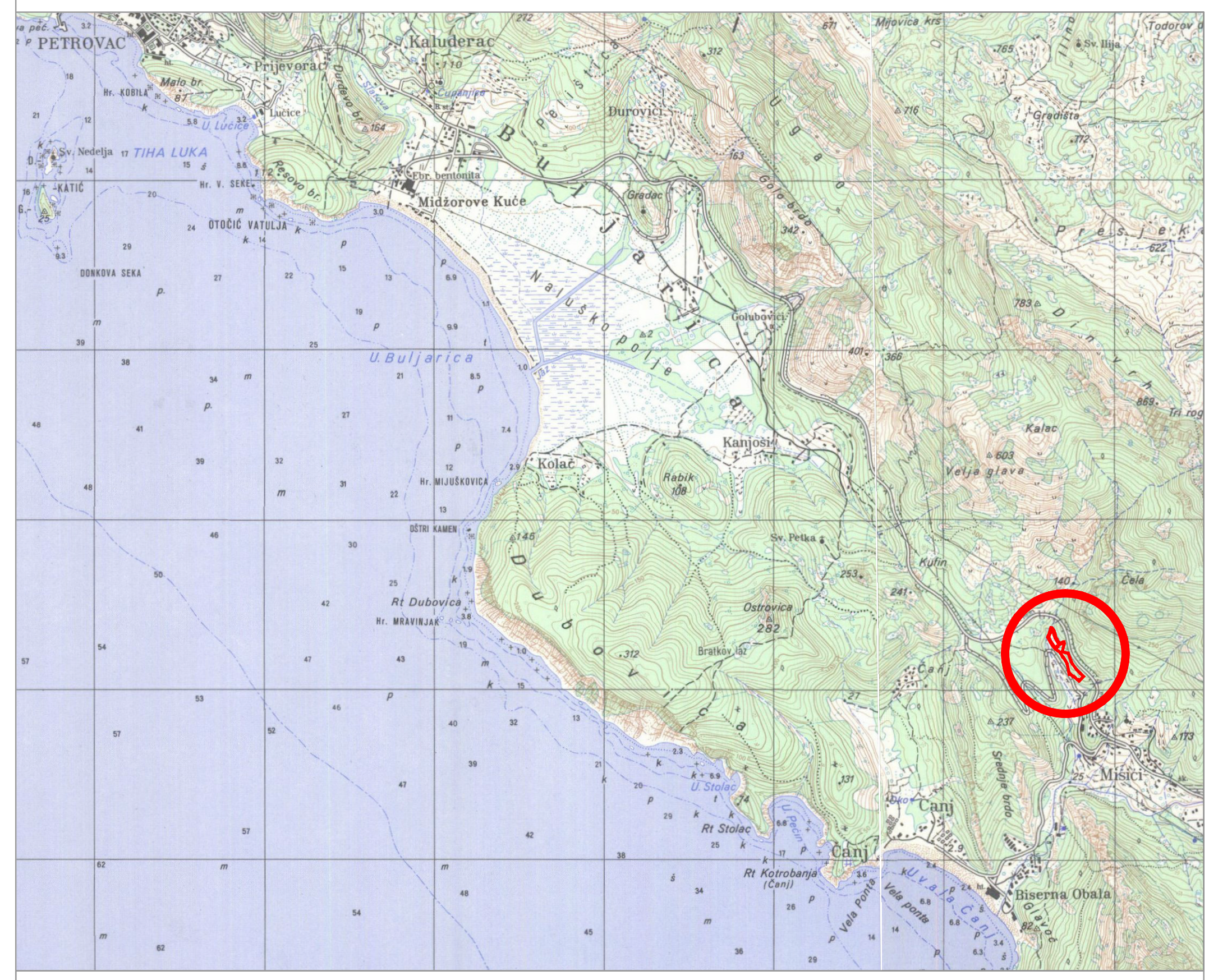
POLOŽAJ LOKACIJE "MIŠIČI 1" U ŠIREM OKRUŽENJU 1:25000

situacija čanj k.o. Mišiči, kat.parc. 898/1, 900/1, 902/1, 902/13, 902/14, 902/15, 902/16, 902/17, 902/18, 902/26, 902/27, 903, 904, 905