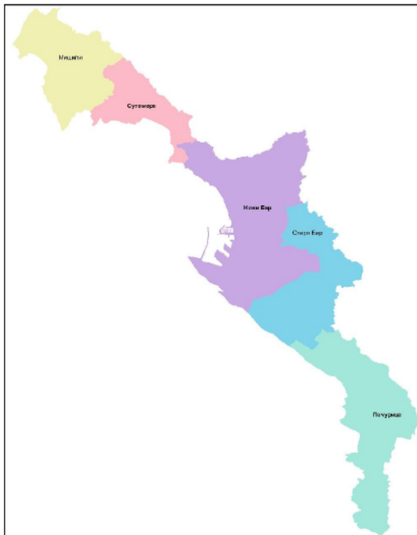
Slika 1. GUP 2020 – Opština Bar – prostorne zone