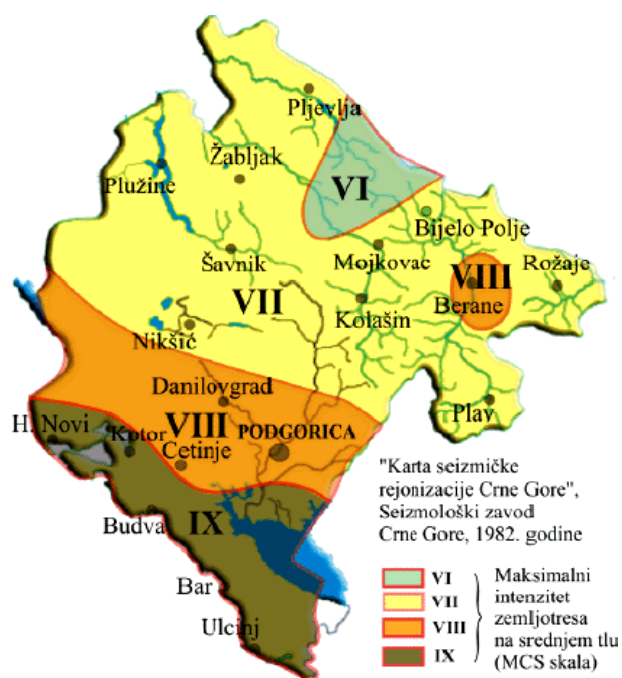
Slika 2. Karta seizmičke rejonizacije Crne Gore (Radulović V., Glavatović B., Arsovski M., i Mihailov V., 1982)

Na osnovu raspoloživih podataka urađena je karta seizmičke regionalizacije (slika 2) za uslove srednjeg tla. „Srednje tlo“ na urbanim prostorima Crne Gore, sa litološkog aspekta, odgovara glinovito-pjeskovito šljunkovitom tlu, sa brzinom longitudinalnih seizmičkih talasa od 1760 m/s, odnosno transverzalnih talasa od 740 m/s, sa srednjom gustinom od 1.9 t/m 3 i prosječnom dubinom podzemne vode od 10 metara.